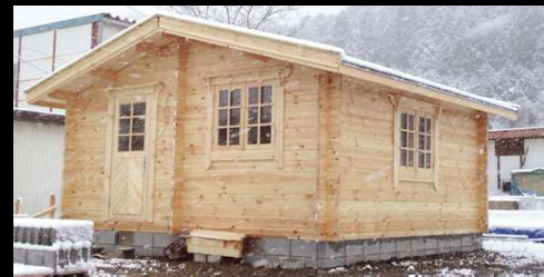
⑨ 塗装なしでもOKですが、オプションで塗装も承ります