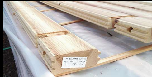
① フィンランド産レッドパインは木目が細かく丈夫

日本ではまだまだめずらしいログハウス。 海外では無垢の木材による素晴らしい音響特性のためレコーディングスタジオにも使用されています。 MUSICAでは3重床材や吸音材、2重ガラス窓を備えた防音ログハウスを開発。 壁材はフィンランド産レッドパイン材。 モデルハウスで皆様のご見学をお待ちしています。