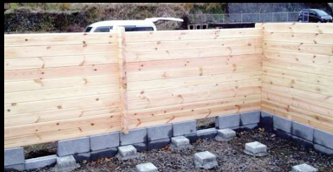
④ 工場でカット済のログによって組み立てられます