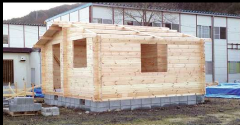
⑥ 屋根には吸音材を入れ防音性を高めます