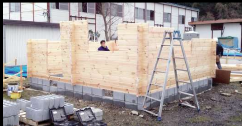
⑤ 工期は最短で40日程度