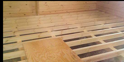
⑦ 床は3重構造。板厚の合計は41mmにもなります