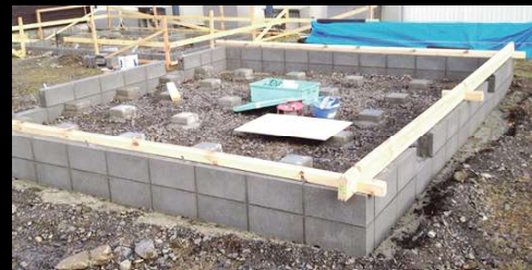
② 12.5畳タイプは本格的な基礎、7.5畳タイプは簡易基礎