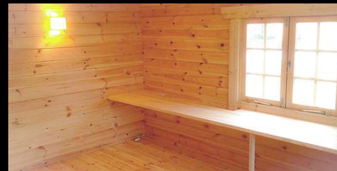
⑧ オプションで机やラックを作り付けることができます