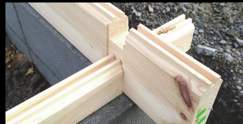
③ ログ(木材)は複雑な切り込みによって強度と耐水性を確保