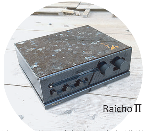
Raicho II pri

プリアンプはトーンコントロールを省いたシンプルな設計が主流。しかし、最新電子部品のクオリティは目を見張るものがあります。本機は最新部品で劣化のない周波数コントロールを可能にしました。また、ケースの素材はノイズレベルを大きく左右します。磁性体ボディと非磁性体のアルミボディでテストすると、ノイズは59%に減少。本機のボディは全て非磁性体です。