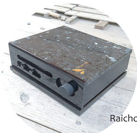
Raicho II power

フロントパネルには真空管がマウントされています。真空管時代の最晩期に医療・軍事用に設計されたサブミニチュア管。真空管の温かなアナログサウンドを再生します。